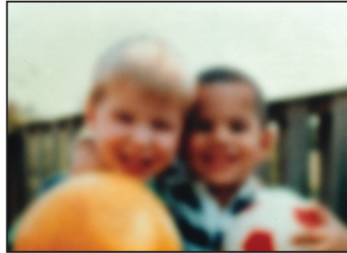
La misma imagen vista por una persona con catarata