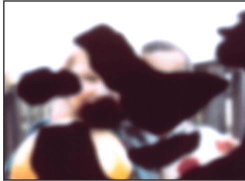
La misma imagen vista por una persona con retinopatía diabética.