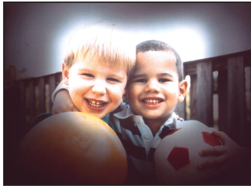
La misma imagen vista por una persona con glaucoma