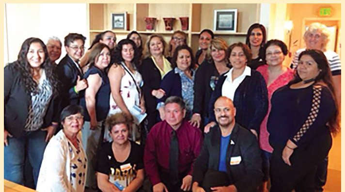
Comité de Abogacía de Promotoras

Establecimos nuestro primer Comité de Abogacía de Promotoras en 2013 para dar apoyo a iniciativas públicas estatales. Los miembros del Comité de Abogacía representan a la Red de California y llevan las preocupaciones locales y regionales al nivel estatal, asegurando que los problemas de las promotoras se tomen en cuenta a nivel local y estatal. Los siguientes proyectos de ley prioritarios promueven una vida saludable y digna para todas y todos en California y han sido identificados por las promotoras para el Día Legislativo de las Promotoras 2025 de Visión y Compromiso.